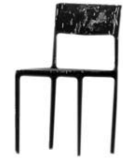
② mobilă / furniture