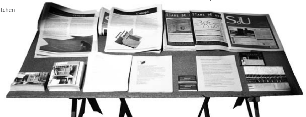
① punct de informare cultural / cultural info-point