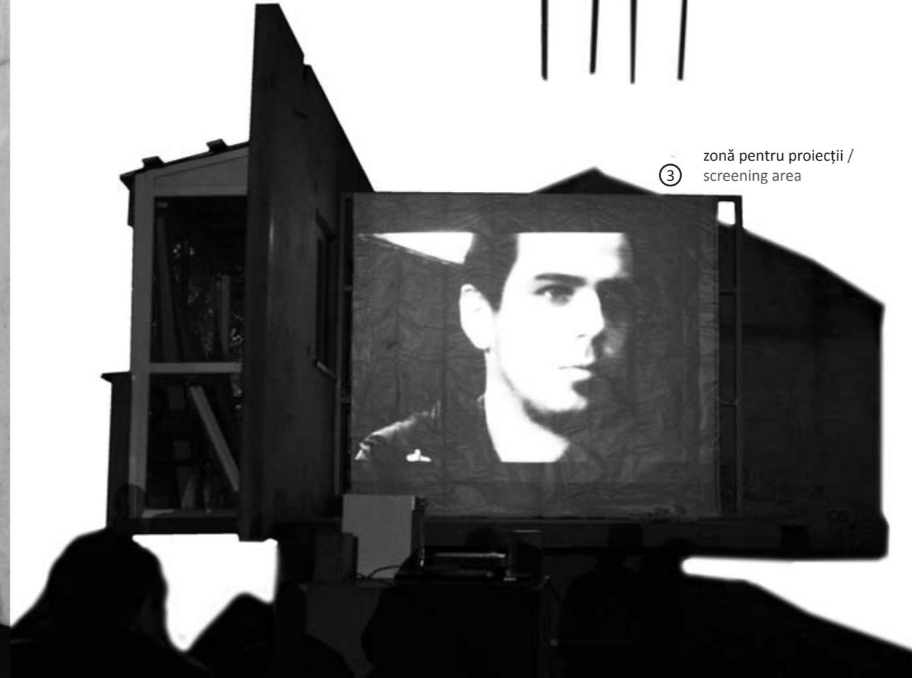
③ zonă pentru proiecții / screening area