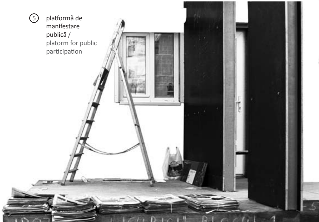
⑤ platformă de manifestare publică / platform for public participation